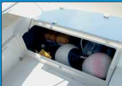
Veliki krmeni gavun