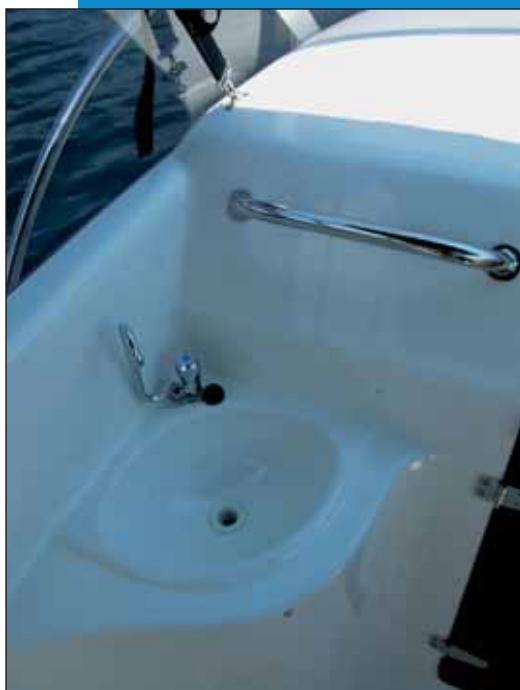
Sudoper u kokpitu

ko bi se osigurali što širi kokpit i kabina, napravljen je kompromis u obliku nestajanja bočnih prolaza.