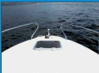
Bokaport osigurava ventilaciju kabine