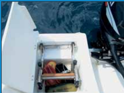
Spremište za skale