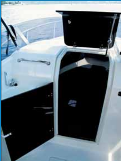
Vrata kabine su od pleksiglasa