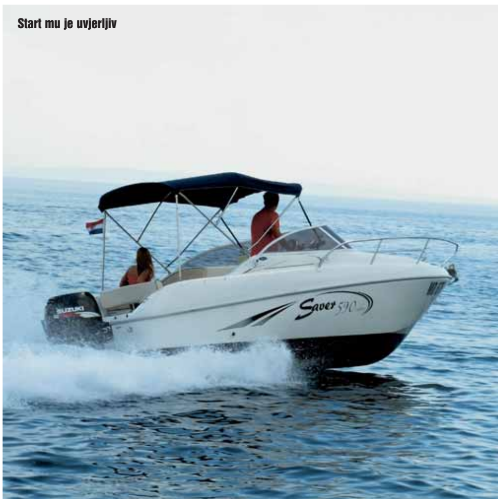
Start mu je uvjerljiv

Treba napomenuti kako su bočne stranice kokpita obložene jastucima, pa eventualni gubitak ravnoteže i instinktivno oslanjanje na njih, prolazi bez modrica. Putnici na stražnjoj krmnoj klupi imaju dobro uporište za leđa, a naslon nestaje na mjestu gdje se prolazi prema krmi. Preciznije rečeno, prema krmnoj platformi