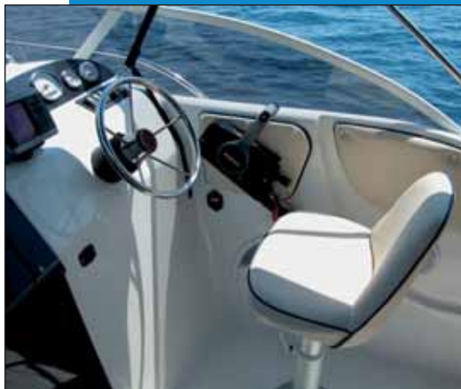
Skiperov stolac se rotira