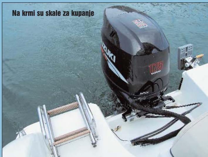
Na krmu su skale za kupanje