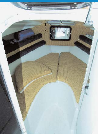
Kabina je prostrana

Kako u klasi plovila s kabinom dužine između šest i sedam metara vlada veća gužva nego ona na naplatnim kućicama u Lučkom prvog kolovoškog vikenda, svaki se brodograditelj pokušava nametnuti svojom vizijom. U Saveru su težište bacili na prostran kokpit, solidne brzinske performanse i praktičan raspored, sve začinjeno kvalitetnom izradom.