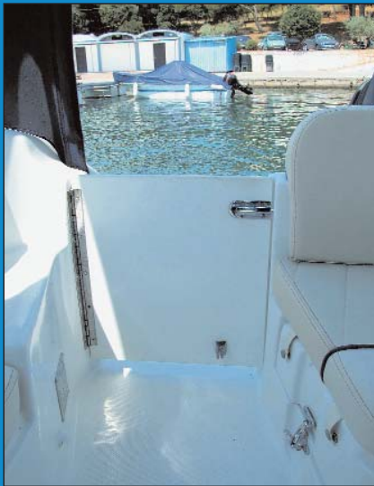
Praktična krmena vratašca