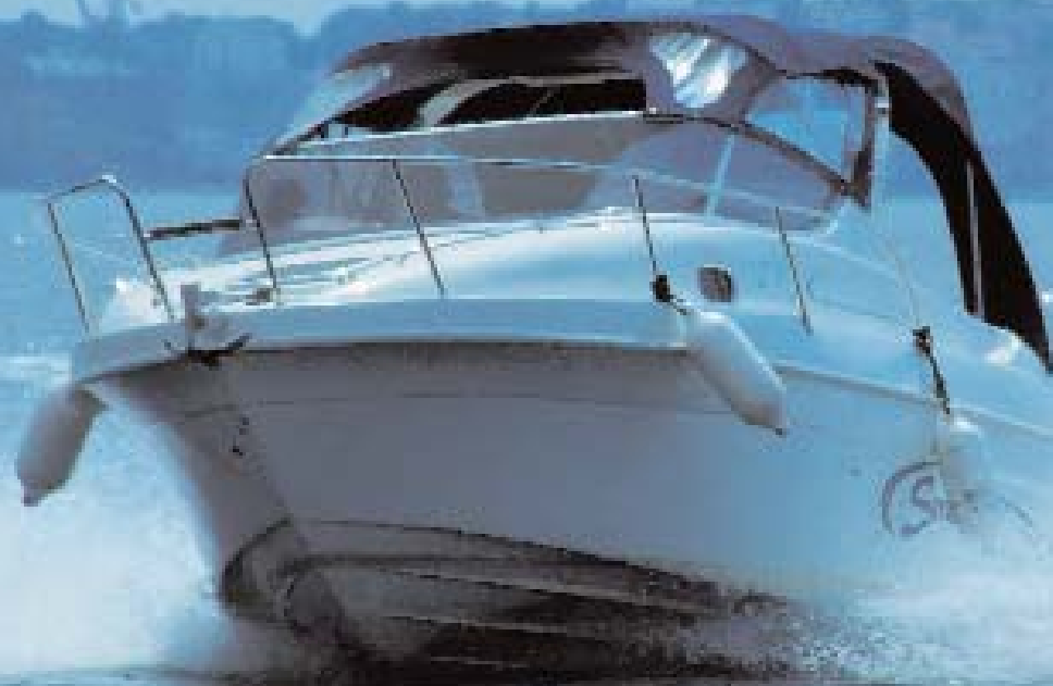
Saver s lakoćom razgrće valove

Gotovo cijelu kabinu zauzima ležaj čije dimenzije obećavaju udoban smještaj za dvije odrasle osobe i dijete, a kako se i u kokpitu može spavati (kada se zakopča tenda), dolazimo do smještaja za prosječnu obitelj