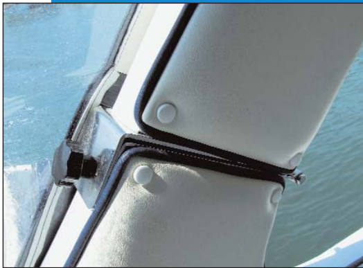
Roll bar se može preklopiti