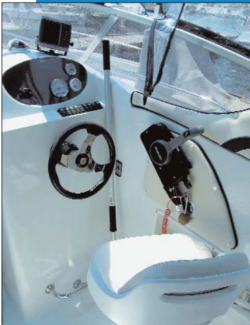
Skiperu je sve pri ruci