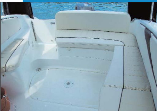
Krmeni kokpit nudi udobnost