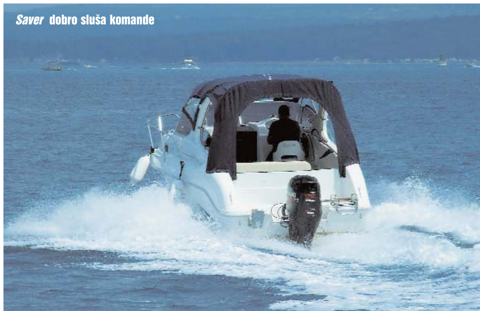
Saver dobro sluša komande

nekoq ozlijede (lagana su), već da se ne bi oštetila od lupanja. Problem se može riješiti naknadnom ugradnjom kukice i nosača, ali to ostavljamo na volju korisnicima plovila. Osim detalja koji pridonose udobnosti, Saver 650 je prepun i onih sigurnosnih.