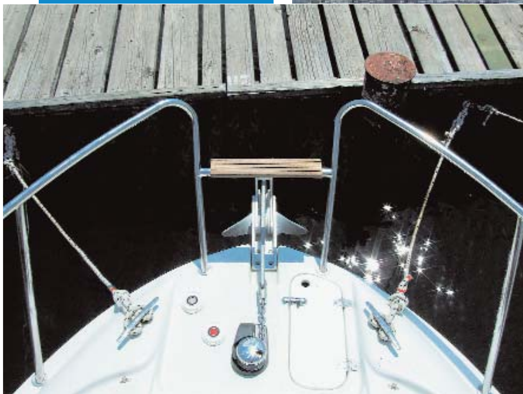
Drvena prečka olakšava ulaz s pramca