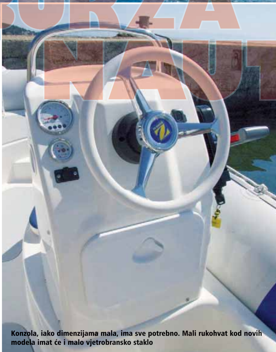
Konzola, iako dimenzijama mala, ima sve potrebno. Mali rukohvat kod novih modela imat će i malo vjetrobransko staklo

kao oštar vrh nego je više tupast. Spremište koje se nalazi u tom prostoru je velikog volumena i nećemo spominjati da je to ujedno i sjedalica za putnike u pramčanom dijelu. Osim za odlaganje opreme, najlogičnija mu je namjena spremanje sidra, sidrenog konopa i opreme za vez. U tu svrhu u samom vrhu napravljen je zarez za provođenje konopa prema pramčanoj bitvi na poli-esterskom podestu postavljenom na vrh tubusa. Obli podest je malen, ali osim bitve za vez na njega je postavljena i vodilica s koloturnikom za sidreni konop. Kako se na podest ne može stati, da bi se iskricali s plovila preko pramca, moramo stati na sam tubus.