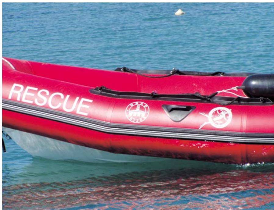
Na vrhu zračnih tuba upleten je konop za držanje i ručke za prenošenje