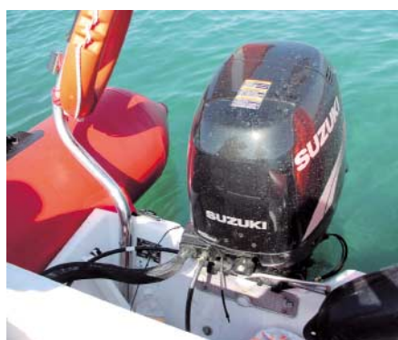
Motor je odvojen od korisnog prostora širokom klupom

dodana klupa dovoljna za jednu osobu, u koju se može smjestiti podosta neophodne brodske opreme. Klupa za skipera ima naslon i dvostruke je dužine, dovoljno da se na nju bez guranja smjeste dvije krupnije osobe, a ispod je smješten rezervoar sa gorivom. Uz njega je ostalo dovoljno mjesta za smještaj još poneke sitnice. U pramčanom dijelu je gavon koji je sastavni dio korita čamca, ali dovoljno velik za smještaj konopa, olova i ostale sitne ronilačke opreme. Kao svaki ozbiljniji radni gumenjак namijenjen ronionicima, i ovaj