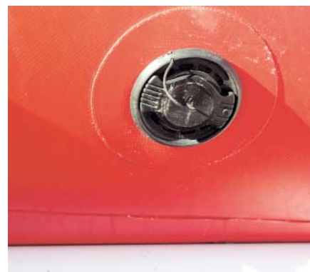
Kvalitetni i dobro postavljeni čepovi

dodana klupa dovoljna za jednu osobu, u koju se može smjestiti podosta neophodne brodske opreme. Klupa za skipera ima naslon i dvostruke je dužine, dovoljno da se na nju bez guranja smjeste dvije krupnije osobe, a ispod je smješten rezervoar sa gorivom. Uz njega je ostalo dovoljno mjesta za smještaj još poneke sitnice. U pramčanom dijelu je gavon koji je sastavni dio korita čamca, ali dovoljno velik za smještaj konopa, olova i ostale sitne ronilačke opreme. Kao svaki ozbiljniji radni gumenjак namijenjen ronionicima, i ovaj